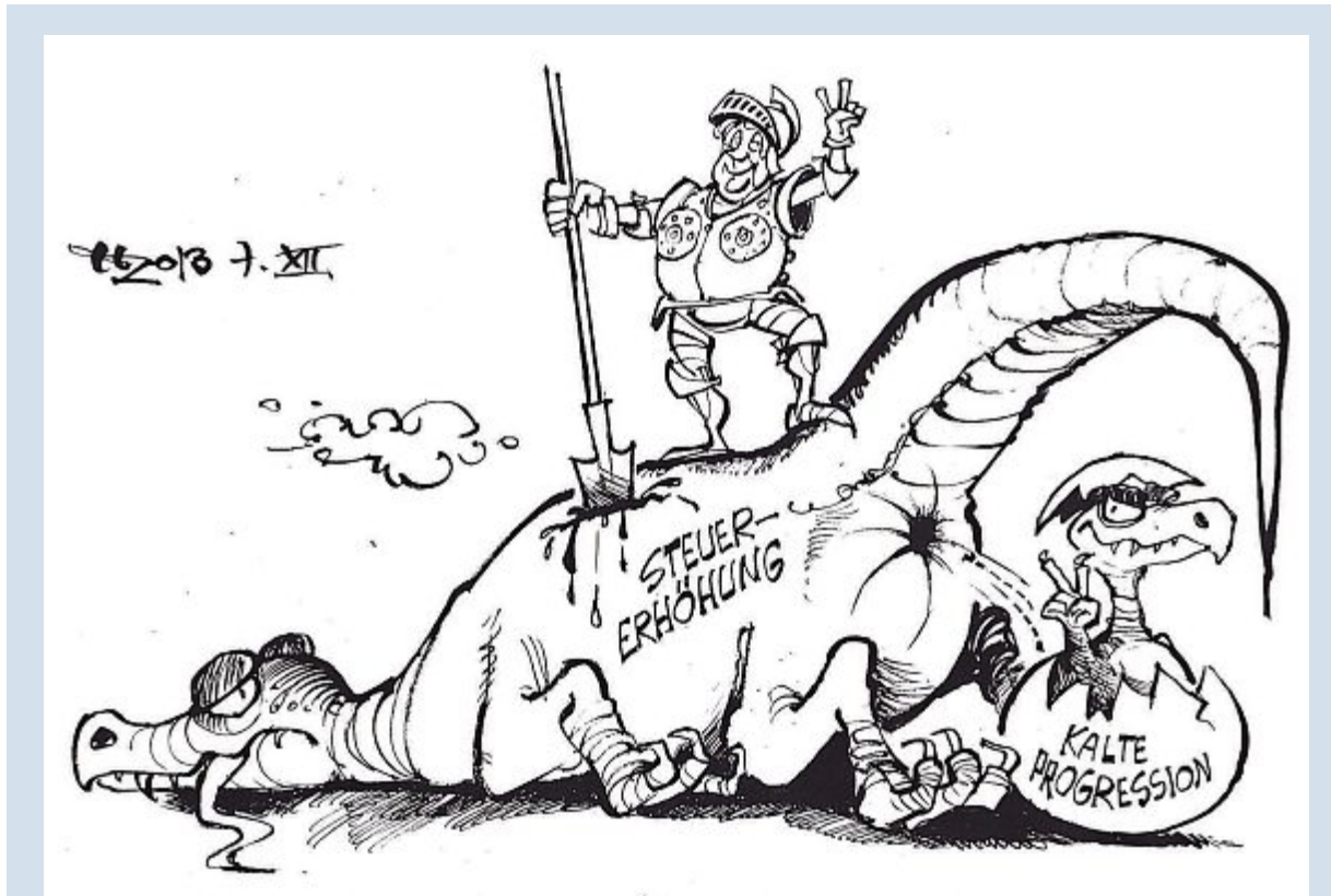
Die Drachentöterin tz-Zeichnung: Haitzinger